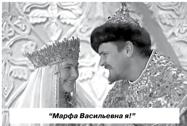
«Марфа Васильевна я!»

«Очаровательно, Марфа Васильевна, очаровательно!» – кто не помнит эту фразу из комедии Гайдая «Иван Васильевич меняет профессию»? Надо сказать, что присутствие третьей жены царя Ивана IV на банкете в добром здравии и веселом настроении – не более чем художественный вымысел. Трагическая судьба отвела юной красавице Марфе Собакиной всего две недели на то, чтобы почувствовать себя царицей. И все это время она прела в ожидании скорой смерти. Среди шести официальных браков русского царя Ивана IV этот был самым непродолжительным и странным. Кстати, на днях в Дзержинке давали оперу Н.А. Римского-Корсакова «Царская невеста» (по одноименной драме Л.А. Мейя), либретто которой воспроизводит печальную историю царицы Марфы, – правда, не совсем правдиво.