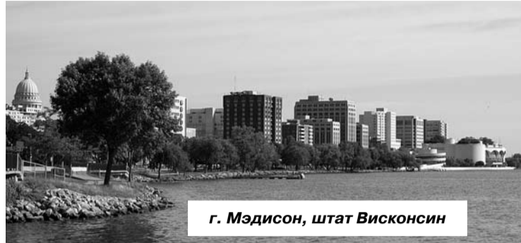
г. Мэдисон, штат Висконсин

Соединенные Штаты – страна с высоко развитой структурой образования. При обучении в американском университете обязательно учитывается интернациональный