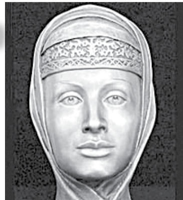
Скульптурный портрет Марфы Собакиной, восстановленный по ее черепу

Тем временем происходят царские смотрины. Выбор царя пал на Марфу. Озабоченный неизвестной болезнью, вдруг настигшей его невесту, Иван Грозный со свойственной ему жестокостью выискивает виновников. И тут в намерении извести девушку зельем сознается под пытками... Иван Лыков. Царь медленно казнит «злодея». Рассудок Марфы не выдерживает тяжести горя; видя безумие Марфы, Грязной с ужасом убеждается, что обманулся в своих надеждах: вместо того, что-