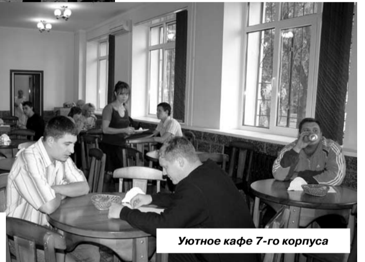
Уютное кафе 7-го корпуса

Я питаюсь... ну, как получится! Если есть настроение, готовим что-нибудь! Основные блюда – это гречка с фаршем, макароны по-флотски или просто макароны, картошка варёная, жареная или тушёная. Час-