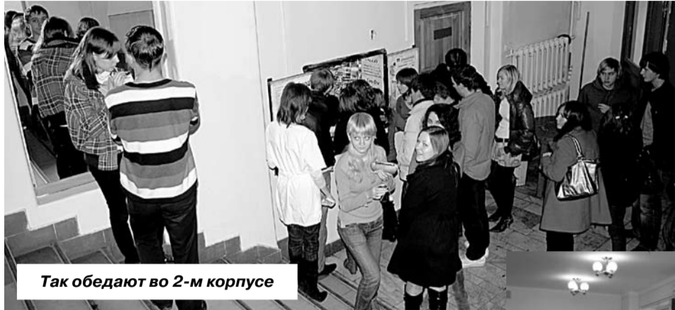
Так обедают во 2-м корпусе

Питание в целом устраивает, общепит – он и в Африке общепит, но я бы не возражал, если бы порции были чуть-чуть побольше.