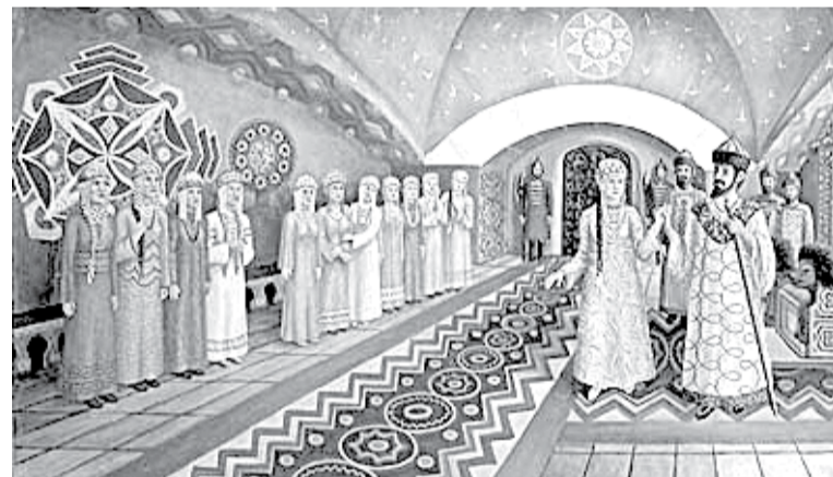
Выбор невесты в Александровской слободе Иваном Грозным.