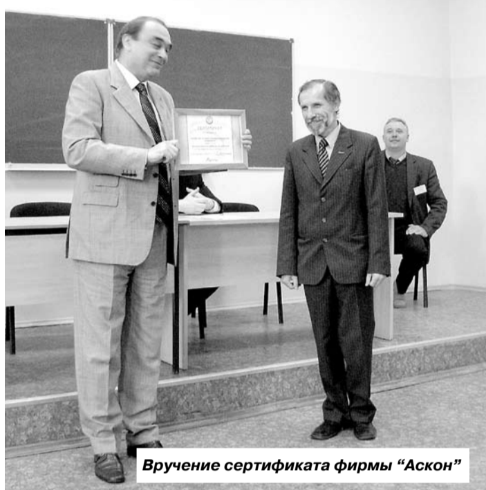
Вручение сертификата фирмы «Аскон»