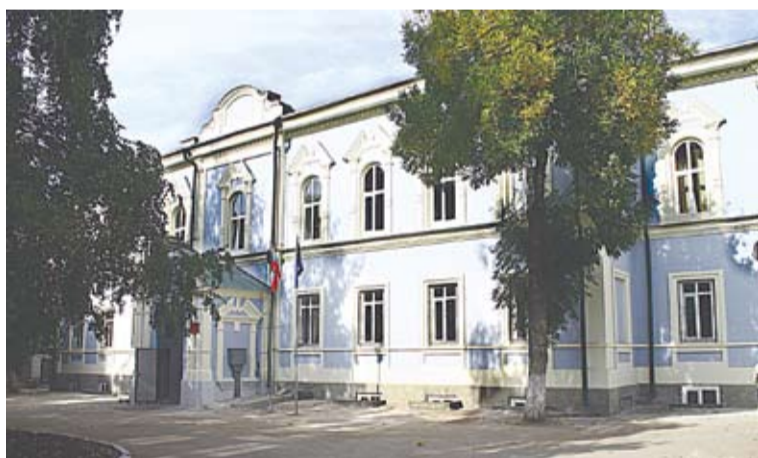
Корпус №5 - Вилоновская, 22