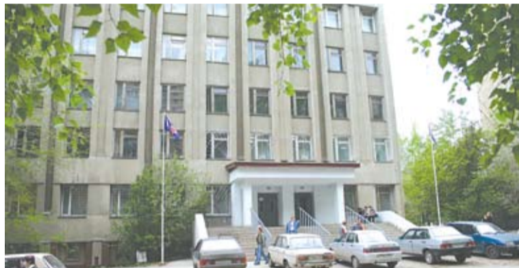
Корпус №8 - Молодогвардейская, 244