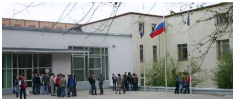
Корпус №7 - Первомайская, 1

Почему лучше быть лучшим выпускником СамГТУ, чем олимпийским чемпионом?