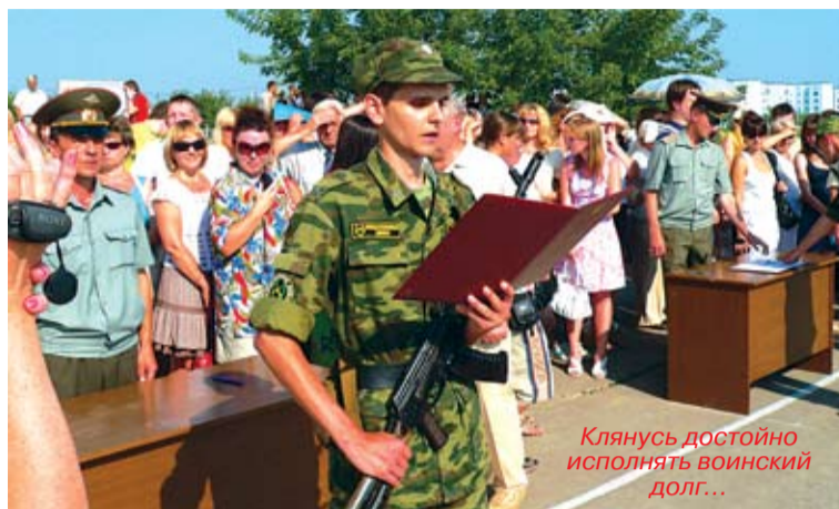
Клянусь достойно исполнять воинский долг...

По питанию жалоб нет. У нас офицеры и курсанты ели из одного котла. Конечно, солдатская каша – это не домашняя еда, но служба есть служба.