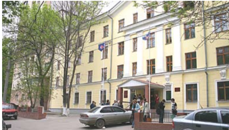
Корпус №10 - Циолковского, 1

Отпечатано с готовых диапозитивов в типографии ОАО «Самарабланкиздат» 443020, г. Самара, ул. Садовая, 46 Тираж 2000 экз. Заказ № Распространяется бесплатно