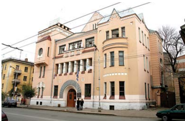
Корпус №2 - Куйбышева, 154