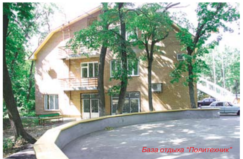
База отдыха «Политехник»

Ученых всех крепи союз, Родной политехнический наш вуз!