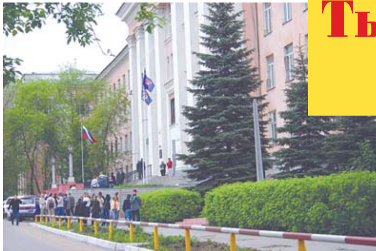
Корпус №1 - Первомайская, 18