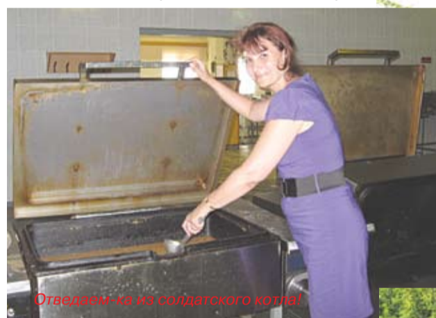
Отдаем кашу из солдатского котла!

Претензий к дисциплине у меня нет. Это объясняется несколькими причинами. Одна из них, я считаю, состоит в том, что с курсантами всегда находились офицеры, которые, в том числе, несли дежурства в казарме. Здесь же отмечу: с курсантами на учебные сборы выезжало 19 офицеров военной кафедры. Я удовлетворен уровнем проводимых ими занятий, их методическим мастерством. Вторая причина – это то, что мы и наши курсанты жили отдельно от военнослужущих других подразделений. Ну и третья причина – это, конечно же, постоянная воспитательная работа, в том числе индивидуальная. А вообще, в случае