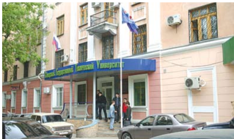
Корпус №9 - Ново-Садовая, 10