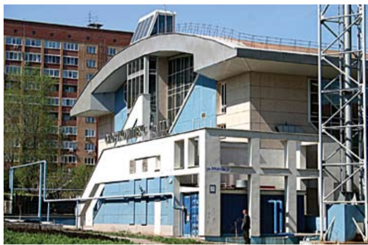
Спортивный комплекс СамГТУ

Профком у нас находится в главном корпусе, на 4-м этаже. Там вам помогут, если нужно, и словом, и делом! Оформят материальную помощь, социальную стипендию.