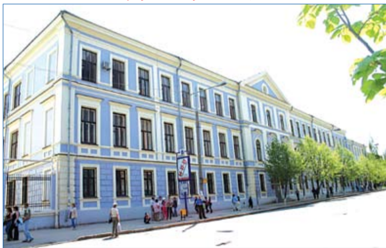
Корпус №3 - Молодогвардейская, 133